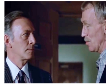
1983 DREAMSCAPE (Dreamscape) de Joseph Ruben avec Christopher Plummer