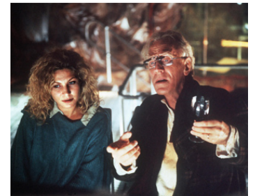
1991 JUSQU'AU BOUT DU MONDE (Bis ans Ende der Welt) de Wim Wenders avec Solveig Dommartin