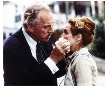
1993 LE BAZAAR DE L'ÉPOUVANTE (Needful things) de Fr. C. Heston avec Amanda Plummer