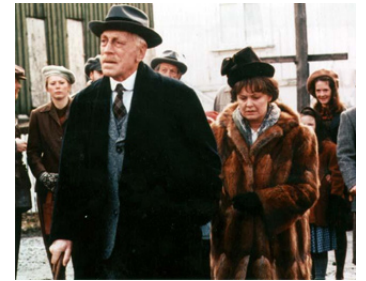
1996 HAMSUN (Hamsun) de Jan Troell avec Ghita Norby