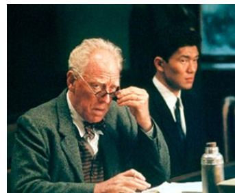
1998 LA NEIGE TOMBAIT SUR LES CÈDRÉS (Snow falling on cedars) de Scott Hicks avec Rick Yune