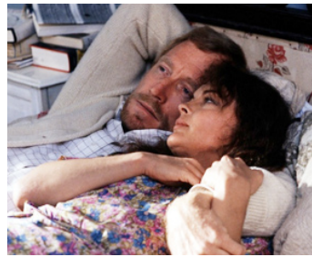
1979 LA MORT EN DIRECT de Bertrand Tavernier avec Romy Schneider