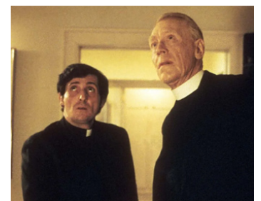
1973 L'EXORCISTE (The Exorcist) de William Friedkin avec Jason Miller