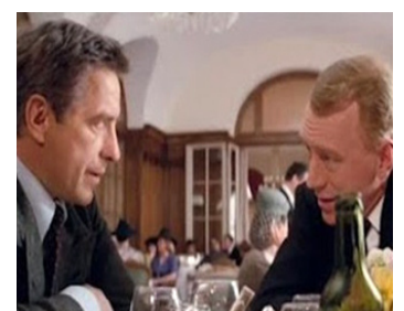
1978 LA CIBLE ÉTOILÉE (Brass Target) de John Hough avec John Cassavetes