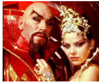
1979 FLASH GORDON (Flash Gordon) de Mike Hodges avec Ornella Muti