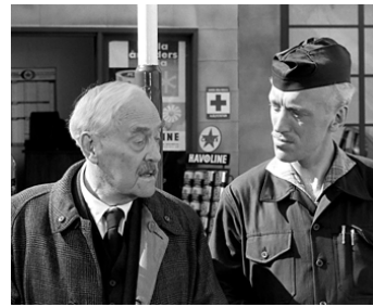
1957 LES FRAISES SAUVAGES (Smultrostället) d'Ingmar Bergman avec Victor Sjöström