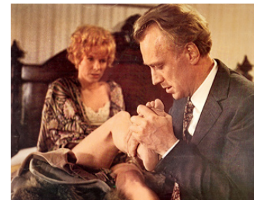
1969 LA LETTRE DU KREMLIN (The Kremlin Letter) de John Huston avec Bibi Andersson