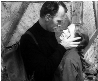
1967 L'HEURE DU LOUP (Vargtimmen) d'Ingmar Bergman avec Liv Ullmann