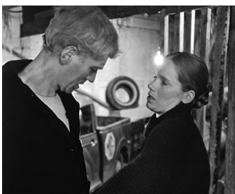
1970 LE VISITEUR (The Night Visitor) de Laslo Benedek avec Liv Ullmann