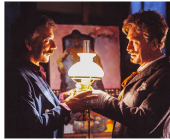
1985 GAUGUIN, LE LOUP DANS LE SOLEIL (The Wolf at the Door) d'H. Carlsen avec D. Sutherland