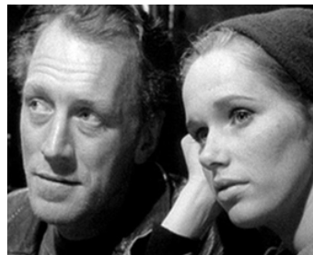
1968 LA HONTE (Skammen) d'Ingmar Bergman avec Liv Ullmann