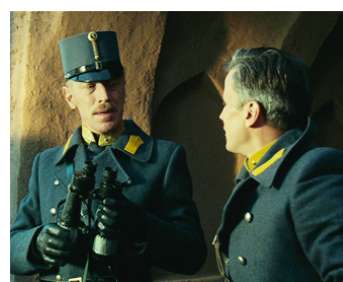
1976 LE DÉSERT DES TARTARES (Il Deserto dei Tartari) de Valerio Zurlini avec Jacques Perrin