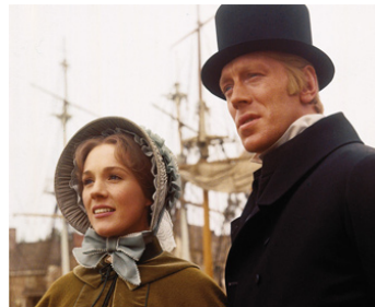
1966 HAWAII (Hawaii) de George Roy Hill avec Julie Andrews