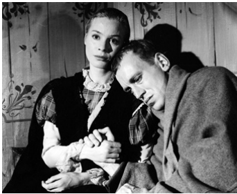
1959 LE VISAGE (Ansiktet) d'Ingmar Bergman avec Ingrid Thulin