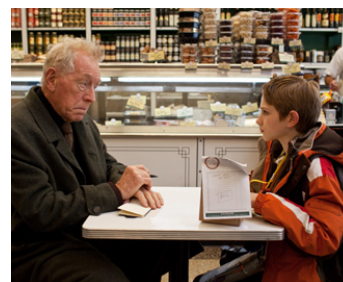
2011 EXTRÊMEMENT FORT ET INCROYABLEMENT PRÈS de Stephen Daldry avec Thomas Horn