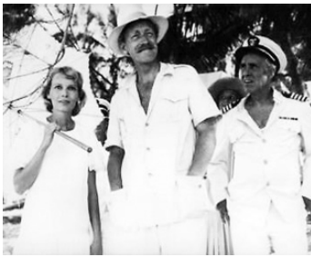
1978 L'OURAGAN (Hurricane) de Jan Troell avec Mimsy Farmer, Jason Robards