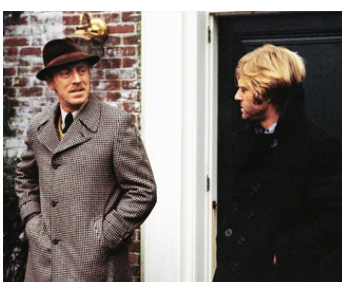
1974 LES TROIS JOURS DU CONDOR (Three Days of the Condor) de Sydney Pollack avec R. Redford