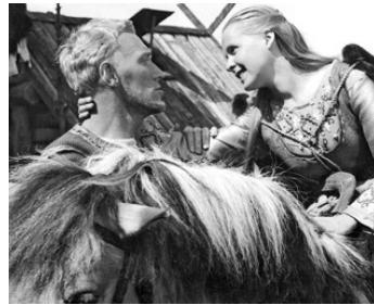
1960 LA SOURCE (Jungfrukällan) d'Ingmar Bergman avec Brigitta Valberg