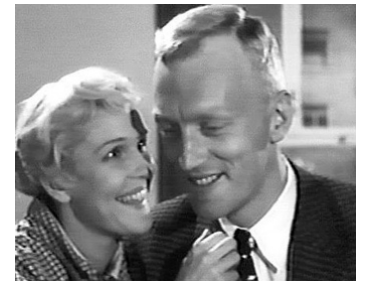
1958 AU SEUIL DE LA VIE (Nära livet) d'Ingmar Bergman avec Eva Dahlbeck