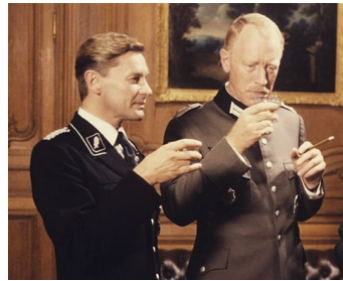
1985 NOM DE CODE ÉMERAUDE (Code name: Emerald) de Jonathan Sanger avec H. Berger