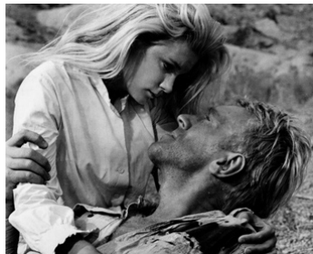
1965 LA RÉCOMPENSE (The Reward) de Serge Bourguignon avec Yvette Mimieux