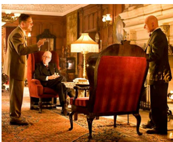
2008 SHUTTER ISLAND de Martin Scorsese avec Leonardo Di Caprio, Ben Kingsley