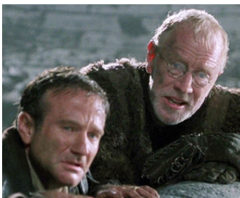
1997 AU-DELÀ DE NOS RÊVES (What dreams may come) de Vincent Ward avec Robin Williams