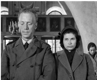
1963 LES COMMUNIANTS (Nattvardsgästerna) d'Ingmar Bergman avec Gunnel Lindblom