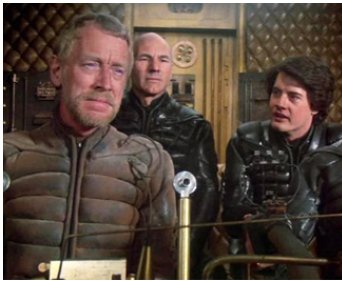
1984 DUNE (Dune) de David Lynch avec Patrick Stewart, Kyle MacLachlan