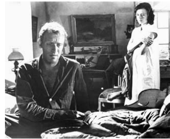
1961 À TRAVERS LE MIROIR (Sasom i en spegel) d'Ingmar Bergman avec Harriet Andersson