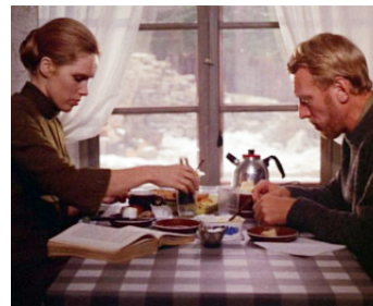
1969 UNE PASSION (En Passion) d'Ingmar Bergman avec Liv Ullmann