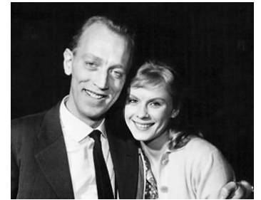
1961 LA MAÎTRESSE (Älskarinnan) de Vilgot Sjöman avec Bibi Andersson