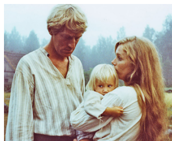
1970 LES ÉMIGRANTS (Untvandrama) de Jan Troell avec Liv Ullmann