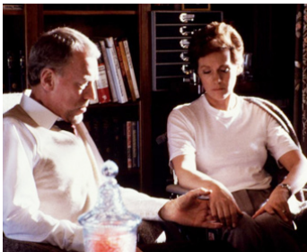
1986 DUO POUR UNE SOLISTE (Duet for one) d'Andrei Konchalovsky avec Julie Andrews