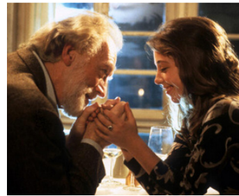
1992 THE SILENT TOUCH (Dotknięcie ręki) de Krzysztof Zanussi avec Beata Tyszkiewicz