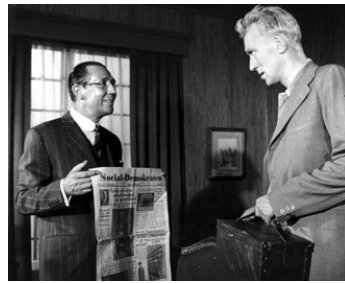
1957 LE PASTEUR D'UDDARBO (Prästen i Uddarbo) de Kenne Fant avec Georg Rydeberg