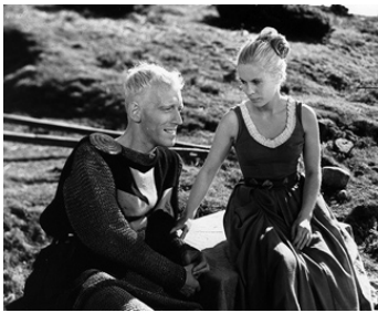
1956 LE SEPTIÈME SCEAU (Det sjunde inseglet) d'Ingmar Bergman avec Bibi Andersson