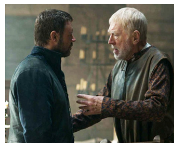
2009 ROBIN DES BOIS (Robin Hood) de Ridley Scott avec Russell Crowe