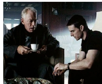
2002 MINORITY REPORT (Minority Report) de Steven Spielberg avec Tom Cruise