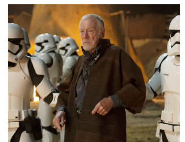
2014 STAR WARS, LE RÉVEIL DE LA FORCE (Star Wars 7, the force awakens) de J. J. Abrams