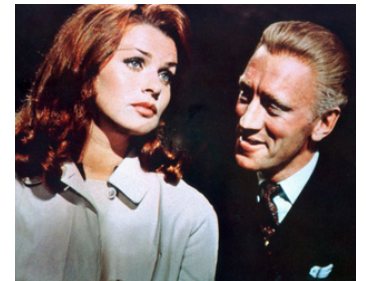
1966 LE SECRET DU RAPPORT QUILLER (The Quiller memorandum) de M. Anderson avec Senta Berger