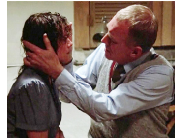
1986 HANNAH ET SES SŒURS (Hannah and her Sisters) de Woody Allen avec Barbara Hershey