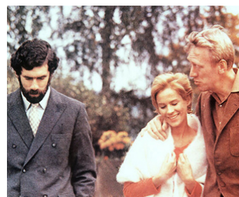
1971 LE LIEN (The Touch) d'Ingmar Bergman avec Elliott Gould, Bibi Andersson