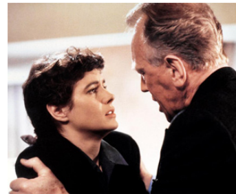
1990 UN BAISER AVANT DE MOURIR (A Kiss before dying) de James Dearden avec Sean Young