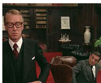
1975 CADAVRES EXQUIS (Cadaveri eccellenti) de Francesco Rosi avec Lino Ventura